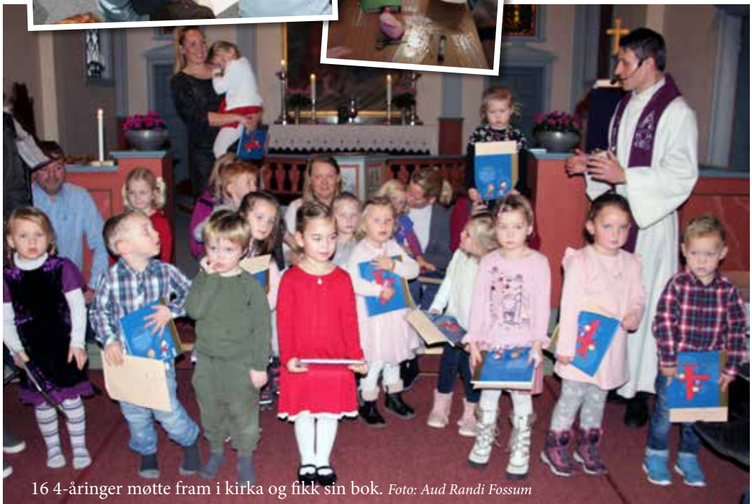
16 4-åringar møtte fram i kirka og fikk sin bok.