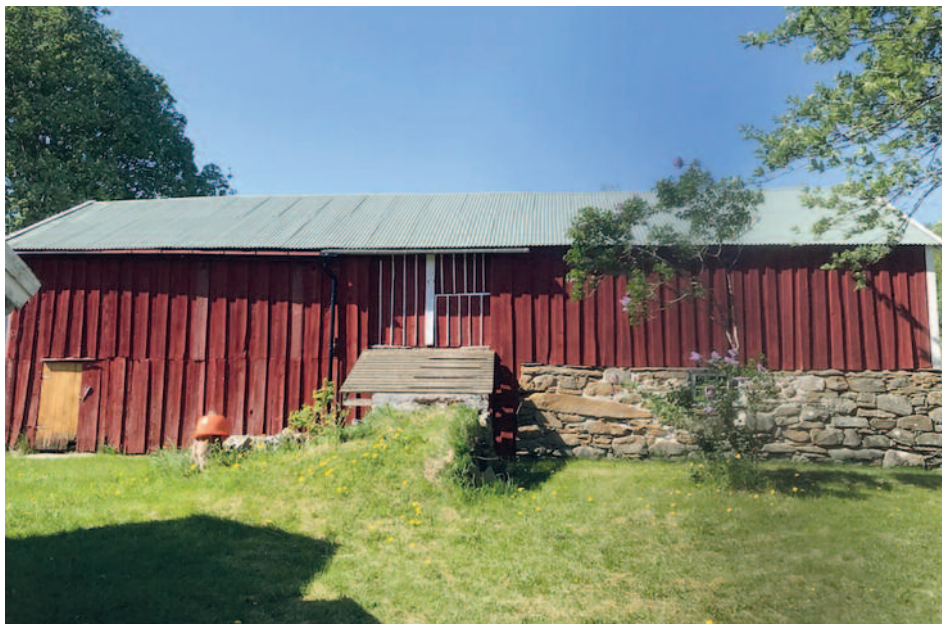
Klassisk gammellåve anno 1800 på Skålvika, Storfosna.

De røde låvene ja; har ikke de alltid vært her? «Nei», sier fagfolkene. Låvene – også kalt enhetslåver eller flerfunksjons driftsbygninger – dukket opp rundt 1850 som følge av det såkalte «hamskiftet» i landbruket. Da ble det innført nye driftsformer som mekaniserte og effektiviserte jordbruket. Og her snakker vi om store og omfattende endringer!