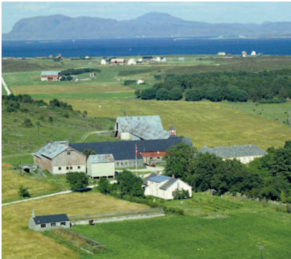
Flott kjørebrulåve anno 1896 på Storfosen Gods.

De mange små uthusene på gårdene og klyngetunene ble gradvis erstattet av stadig større enhetslåver som samlet husdyra, husdyrgjødsla, fôret, kornet, halmen og den stadig voksende redskapsparken under ett, felles tak. I første omgang bygd med husdyrrom med stein- eller tømmervegger i 1. etasje, og avlingslager i etasjen over og i djupstålet med adkomst via den utvendige låvebrua opp til låvegolvet. Husdyrgjødsla ble skuffet ut gjennom gluggen i veggen og lagret utendørs, av og til med et enkelt tak over.