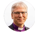
Preses Olav Fykse Tveit. Juleandakt til menighets- blad i Nidaros.