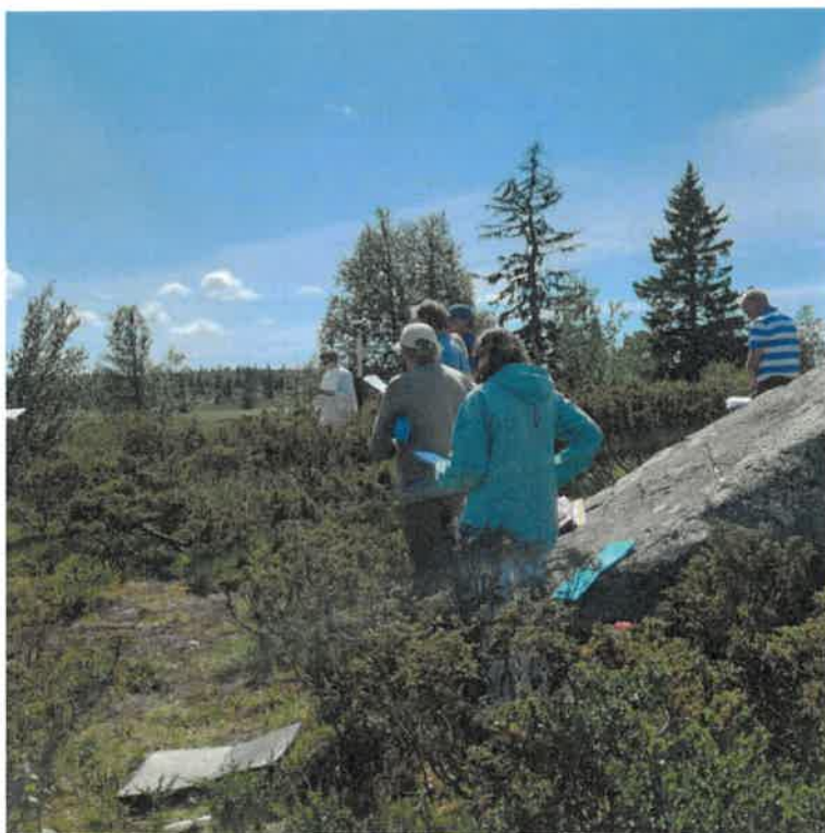
Fra Svarverstuggugrava i 2023.