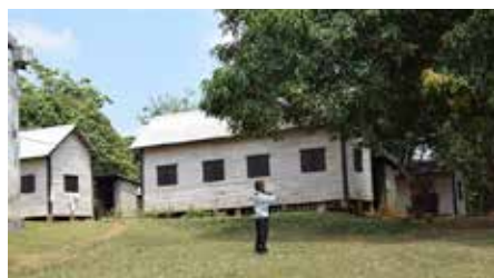
Hus for de mentalt syke i Filadelfia.

Y's Mens Club har gitt mange hundre tusen kroner for å bygge opp stedet slik det er i dag. Filadelfias Venner har også samlet inn mye penger til dette. Filadelfias Venner bidrar i dag med penger til å drive sykestuen, skolen, kantinen og oppdyrking av jordeiendommen. Mange enkeltpersoner og foreninger støtter arbeidet. Ganddalen menighet har Filadelfia Sykelandsby som sitt misjonsprosjekt, og Gand Y's Mens Club støtter også driften av skolen med et årlig beløp. Den gassiske stat betaler lønna til jordmora i sykestuen og lønna til en av de fem lærerne. Presten og hyrdene har ansvaret for de mentalt syke. Til alle givere: Tusen takk for all støtte til det fine arbeidet i Filadelfia syklandsby på Madagaskar! Det nytter å hjelpe!