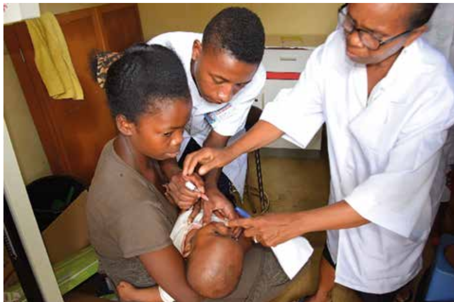
Jordmora og en praktikant vaksiner.

Hvert år gir Gaddalen menighet 10% av offergaver og givertjeneste til Filadelfias Venner, som er med og drifter Filadelfia syklandsby på Madagaskar. Filadelfia var opprinnelig et omsorgssenter for mentalt syke mennesker. Stedet eies i dag av Den gassisk lutherske kirke.