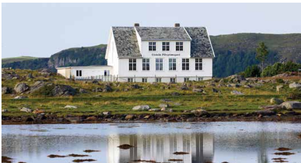
Utstein Pilegrimsgard på Mosterøy holder åpent for overnatting i sommer.

Vil du vite mer om noen av sommerens pilegrimsturer, se kirken.no/stavanger og velg MENIGHETSLIV og RETREAT/PILEGRIM. Sjekk også utsteinpilegrimsgard.no eller pilegrimsleden.no .