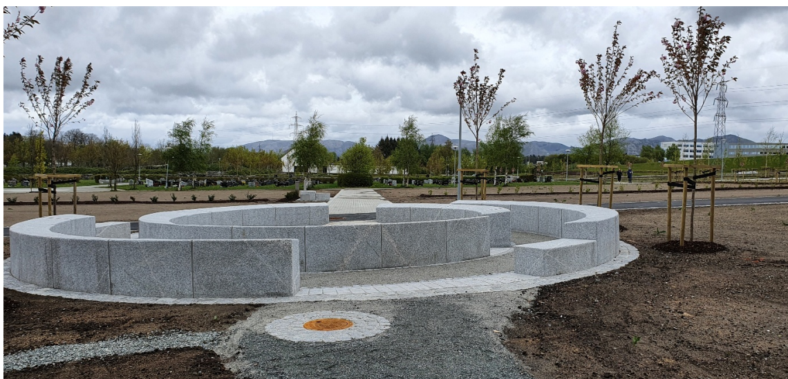
Navnet minnelund Soma-gravlund (Sandnes kommune nettside)