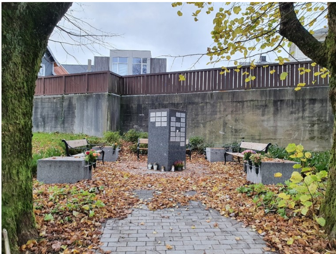
Navnet minnelund for nye urner, Sandnes gamle gravlund (Sandnes kommune hjemmeside)