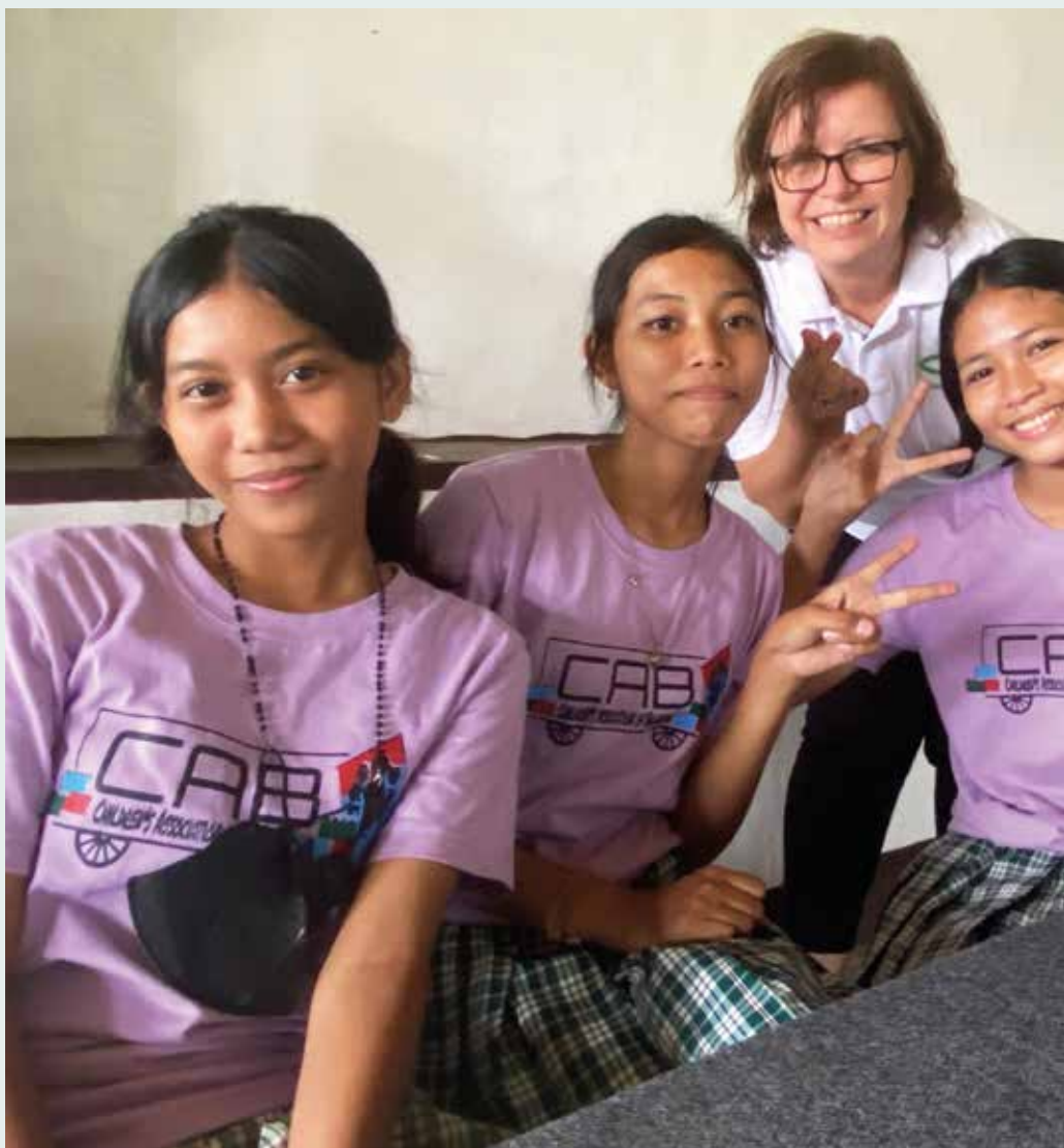
Misjonsalliansen arbeider med utdanning, og jobbskaping. Det er å utruste fattige til å komme i jobb slik at de kan få bedre liv økonomisk.

Noe av det Misjonsalliansen har vært mest kjent for i mange år er fjernadopsjon