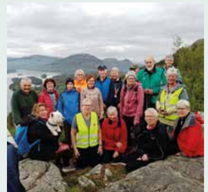
Sanitetsforeningen på Kløvertur til Kråkeberget.