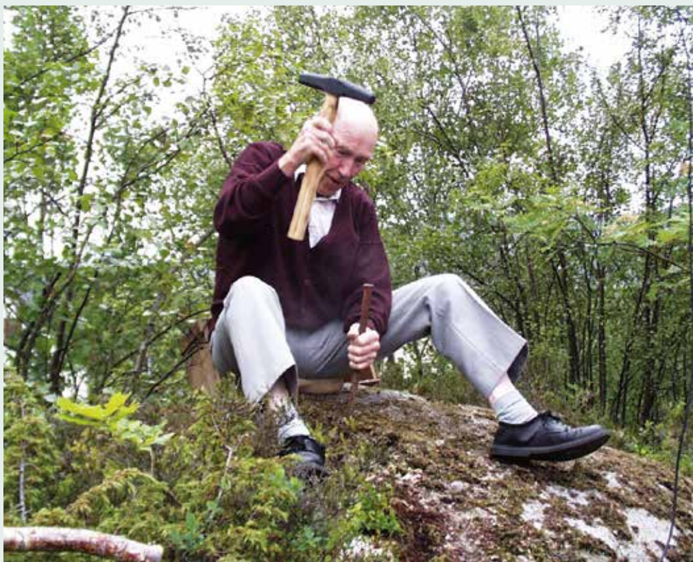
Fra første "spadestikk" i 1999.

Riska menighet er en aktiv menighet med tilbud til alle aldersgrupper. Kirkebygget medvirker i stor grad til dette ved å gi rom for fysisk aktivitet og til stillhet og ettertanke. Vi møter