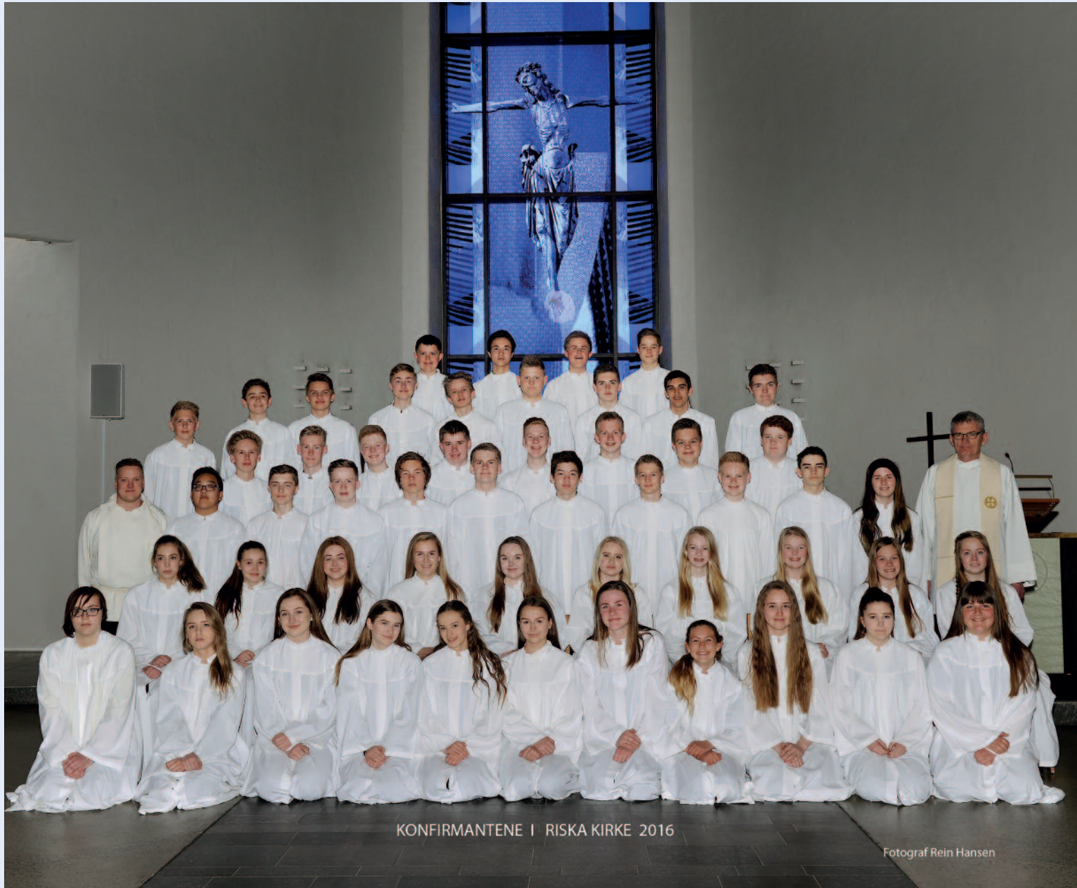
KONFIRMANTENE I RISKAKIRKE 2016