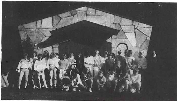
Konfirmantundervisningen er igang igjen! På bildet ser vi årets kull av Engerkonfirmanter samlet til første undervisningstime. Lykke til konfirmanter!