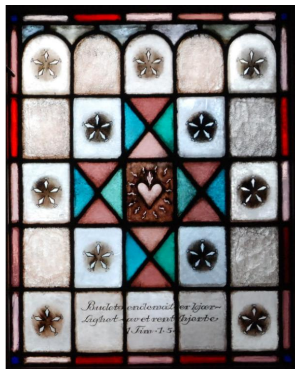
Bilder av glassmalerier i Askim kapell