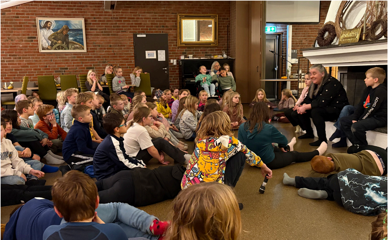
Amigosleiren hadde deltakere fra hele distriktet.

det er flere som samarbeider, det blir flere voksne som bidrar og alle har sine styrker som gjør at det blir et varierende og spennende opplegg for barna.