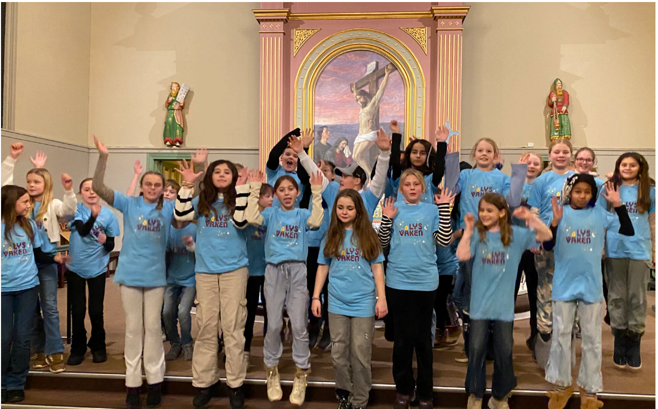
Fornøyde barn på Lys våken i Askim kirke.