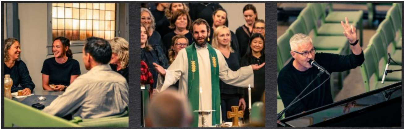
Det ble avholdt 12 G2 i løpet av 2024. Biskopen har godkjent videreføring av prøveprosjektet G2 Lovsangsmesse ut år 2026.

økt bevissthet hos ansatte om at vi bør jobbe strategisk med kommunikasjon rundt arbeidet vårt for å nå ut. Alle teamene har for eksempel publiseringsplan på Facebook for uka, og alle team jobber for å ha en levende Facebookside. Alle menigheter har nettsider med oppdatert kalender og en del av menighetene legger også ut saker jevnlig om hva som skjer. Våre digitale verktøy snakker også sammen slik at den nasjonale satsningen skjer i kirken. no oppdateres med når det er gudstjenester i Indre Østfold. På den måten kan både faste innbyggere og besøkende raskt orientere seg om hvor de kan gå på gudstjeneste i vårt nærmiljø.