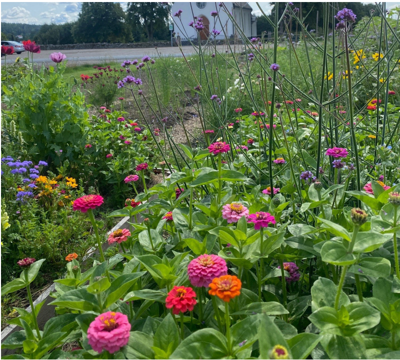
Plan for klosterhagen ved Eidsberg kirke