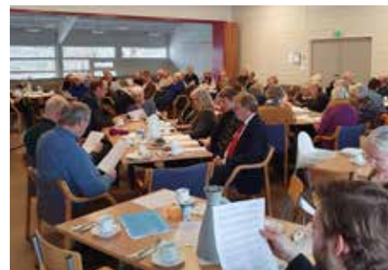
KIRKEKAFFE: Etter gudstjenesten søndag 2. februar var det kirkekaffe på Grøtvedt menighetssenter.

med ungdommer som deltar i ledertreningsopplegget i menigheten.