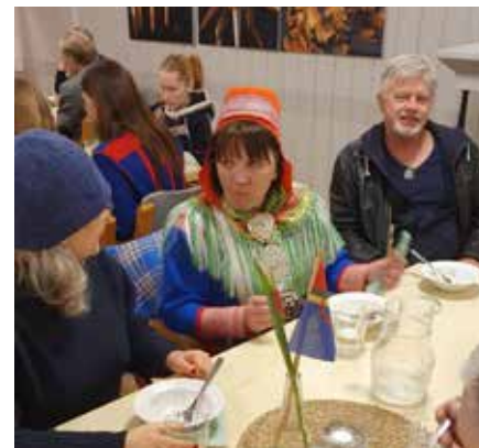
BIDOS: Etter gudstjenesten ble det servert bidos. Bidos er en matrett av reinsdyrkjøtt, poteter, grønnsaker og kjøttkraft. Retten regnes som samefolkets festmat. Navnet på retten er fra nordsamisk språk.