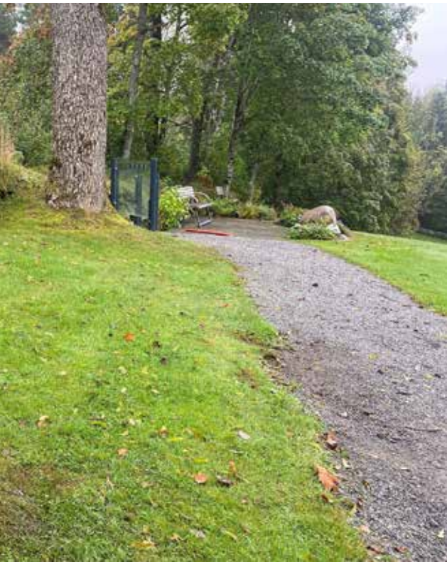
MINNELUND: Navnet minnelund kom på plass ved Trøgstad kirke i slutten av 2024.

entreprenør er valgt. Men fellesrådet må låne penger til dette prosjektet, og har søkt kommunen om en lånegaranti. Den ble behandlet i formannskapet 4. februar. Formannskapet vedtok å sende saken tilbake til kommunedirektøren og fellesrådet. FR fikk beskjed om å se om byggeprosjektet kunne gjøres billigere, og kommunedirektøren skal undersøke om det finnes ledige lokaler i kommunal eie som kan tilbys fellesrådet. Saken kommer så opp igjen i mars måned. Dette betyr i praksis at byggeprosjektet skyves ut i tid.