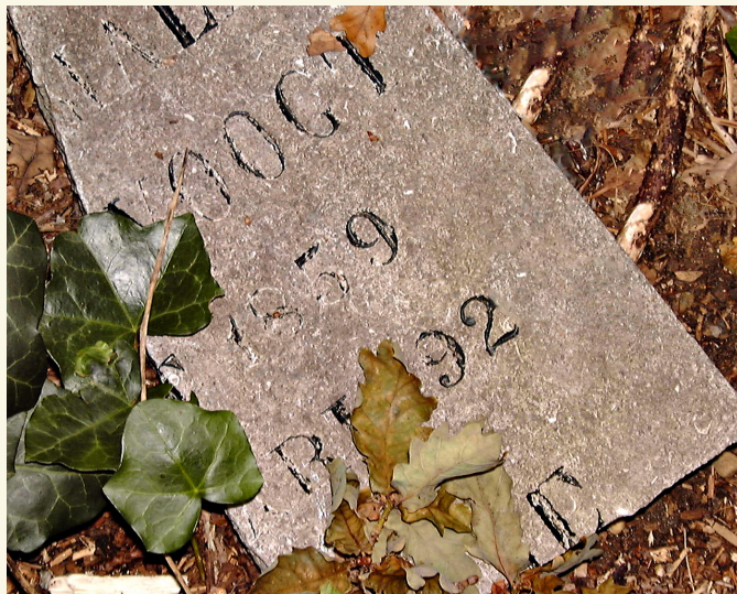
Foto: Med våren så kommer telehiv. På kirkegårdene sees dette tydelig da enkelte gravminner/gravsteiner ugjør seg. Jfr. kirkegårdsvedtektene, er det den enkelte gravfester (eier av gravstedet) som har ansvar for vedlikehold av gravminnet og plantefeltet i forkant.

Gravminner som står i fare for å velte utgjør en risiko for de som ferdes på kirkegårdene, og kirkevergen ønsker å oppfordre festeansvarlig til å vurdere om det er behov for å rette opp gravminnet. Hvis det er behov for oppretting, er det i utgangspunktet tre alternativer for å få dette gjort.