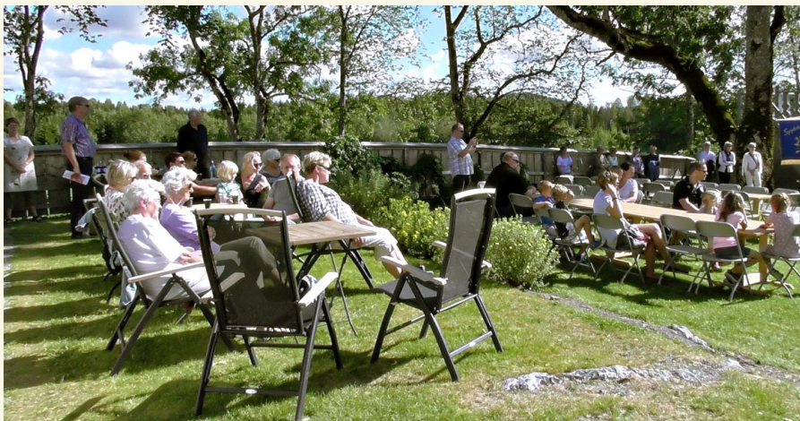
Dette er Prestegårdshagen anno 2015. Håper vi blir like heldige i 2016 — VELKOMMEN!

N å kan du legge opp til familiebesøk sommeren 2016 med besøk på Prestegården — verd et besøk!