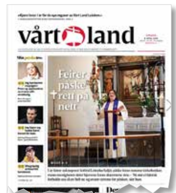
Den digitale satsningen i Indre Østfold havnet også på forsiden av avisen Vårt Land.