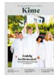
Forside: Mortenstua-konfirmantene