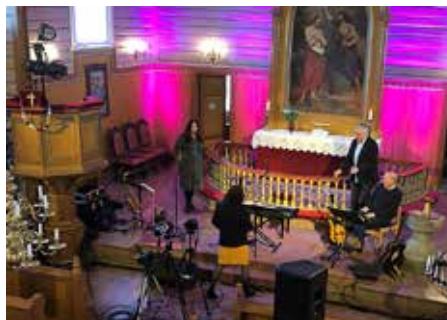
2. påskedag var det direktesendt ønskekonsert fra Båstad kirke på Facebook, og ønskene strømmet på.

— Det er helt klart en arena hvor vi må være tilstede. Det har koronatiden vist oss. Det er bare å følge med på Facebooksidene våre. ■