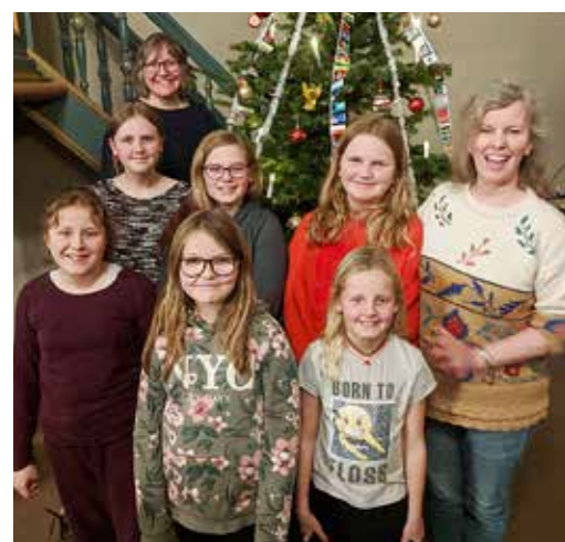
Jentekoret søker flere medlemmer! Her er noen av jentene som er med i koret.