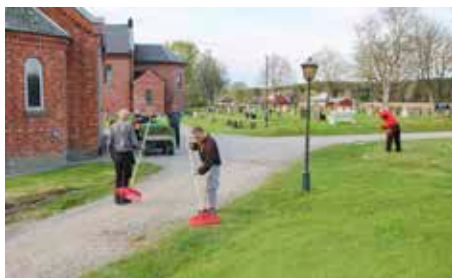
...og inne på kirkegården.