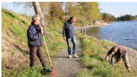
Det ble klippet og raket langs sjøen...