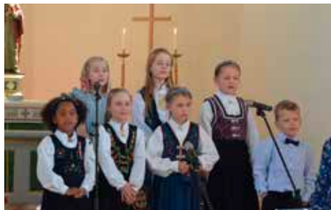
Familiegudstjeneste. Sang ved Gledessprederne.