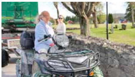
Kjekt å ha med en 4-hjulning for å kjøre vekk alt som ble raket i sammen på utsiden og innsiden av kirkegårds-muren.