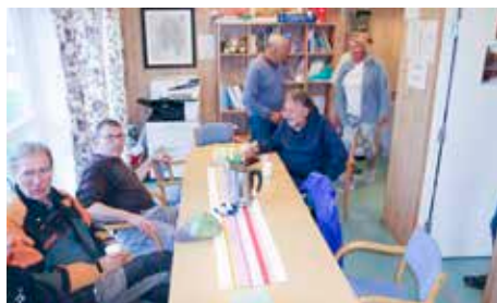
Også her ble kvelden avsluttet med kaffe og kaker