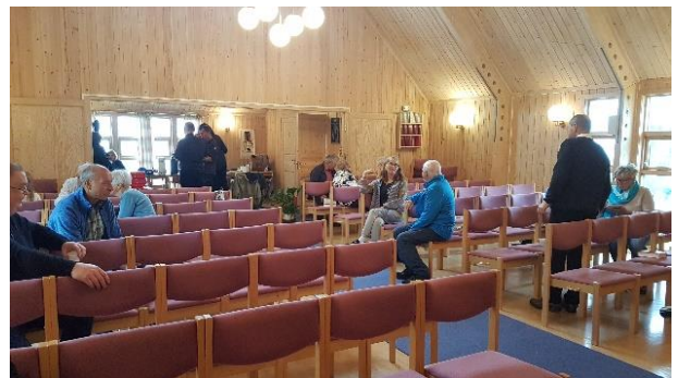
Kirkekaffe etter gudstjenester i Langfjord kirke og Rognsund kirke