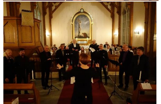
Adventskonsert i Talvik kirke