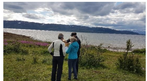
Aktivitet rundt postkassa på Årøya

Diakoni er kirkens omsorgsarbeid og defineres som nestekjærlighet, inkluderende fellesskap, vern om skaperverket og kamp for rettferdighet. Kirkegårdsandaktene på sommer/tidlig høst er en del av dette arbeidet. Det er flere frivillige med i diakonitjenesten i Talvik, med bl.a å ordne til kirkekaffe etter gudstjenester og klokkertjeneste ved gudstjenester.