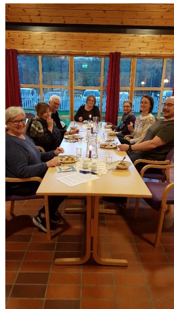
Menighetsmøte i Leirbotn kirke

Arbeidsutvalget består av leder, nestleder, sokneprest og menighetssekretær (som protokollfører). AU har møter/telefonmøter i forkant av menighetsrådsmøtene for å gjennomgå sakslista og vedta innstillinger til menighetsrådet. I en del saker har AU fullmakt til å gjøre vedtak. Arbeidsutvalget hadde 5 møter og behandlet 22 saker i fjor.