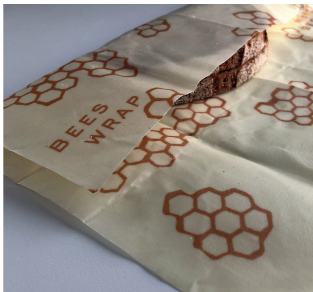
Skivene til lunsjen både ser bra ut og smakar godt i bivokspapir

FOR FLEIRE AV MINE KVARDAGSVANAR: SJÅ @INGVILDDALHUS PÅ INSTAGRAM