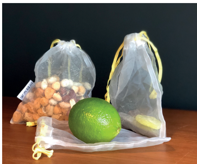
Lausvektsposar til handling og oppbevaring