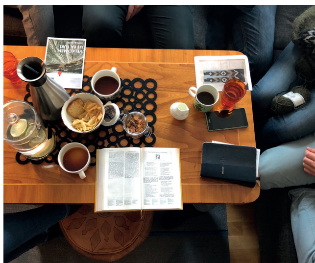
Bestemor sitt spisebord kjem godt med når husgruppa er på besøk