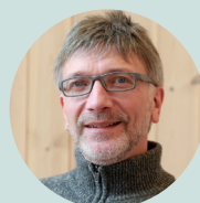
Odd Leif Mjøs