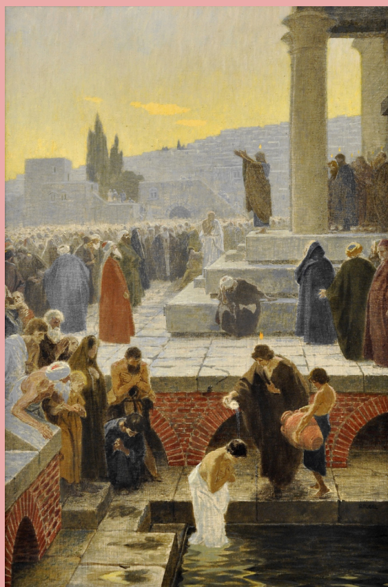
Gebhard Fugel: "Pinsepreike"

Språk kan skille og språk kan samle. Pinsedagen var starten på å samle alle som er spredt og skilt, samle oss om