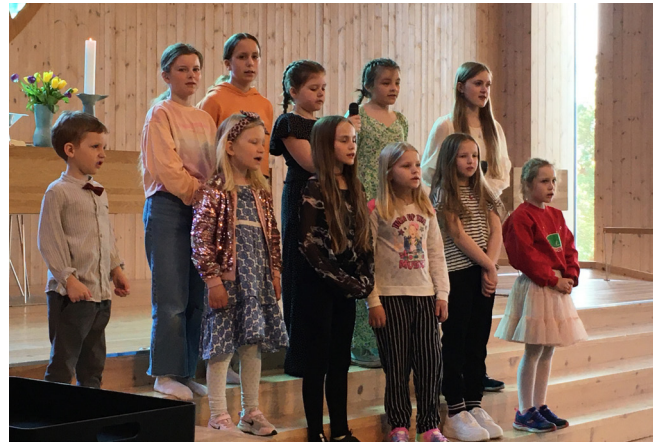
Vakker song av ei gruppe frå Sing Singeling og Sing Out på påskesonggudsteneste.

På programmet sto vakker song av ei gruppe frå Sing Singeling og Sing Out og heile kyrkjelyden fekk vere med og synge dei kjære påskesalmane våre.