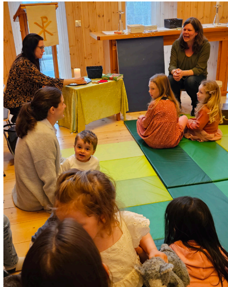
Me tenner det store Jesus-lyset. Deretter tenner me eit telys for kvar enkelt i Jesus-lyset.

Under nattverden blir me igjen ein del av den store gudstenesta i kyrkjerommet. Avslutningsvis er det kyrkjesaft, og ofte fortset leiken.