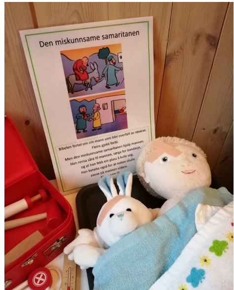
I likninga om den miskunnsame samaritanen lærer me at det er fint å hjelpe andre, og kva- randre. Bamsane fekk ekstra god hjelp denne søndagen.