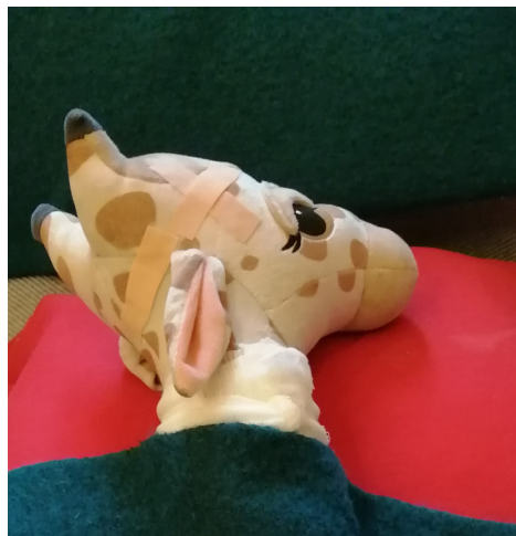
Sjiraffen fekk bandasje rundt halsen, plaster på hovudet, og kunne kvile seg på sofaen i tårnrommet.