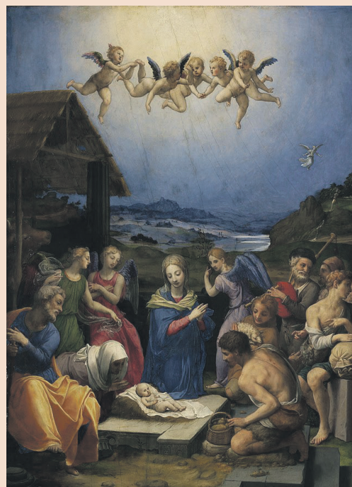
«Hyrdane som tilber». Agnolo Bronzino. 1502-1572

Takk for meg! Det har vore ei festreise å vera biskop i Bjørgvin. Eg ønskjer dykk alle ei gledeleg jul og Guds velsigning!