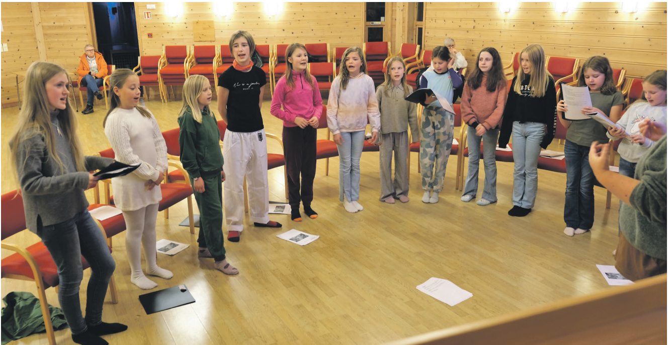
JULESPEL: Sing Out går laus på julespelet med liv og lyst. Også Sing Singeling skal vera med på julespelet i Knarvik kyrkje 8. desember.