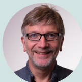
Odd Leif Mjøs