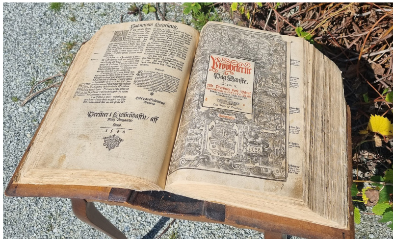
Bibelen vart trykt i København i 1588 og 1589, slik det går fram på desse sidene frå Salomos Høgsong og innleiinga til dei gamlestamentlege profetane.