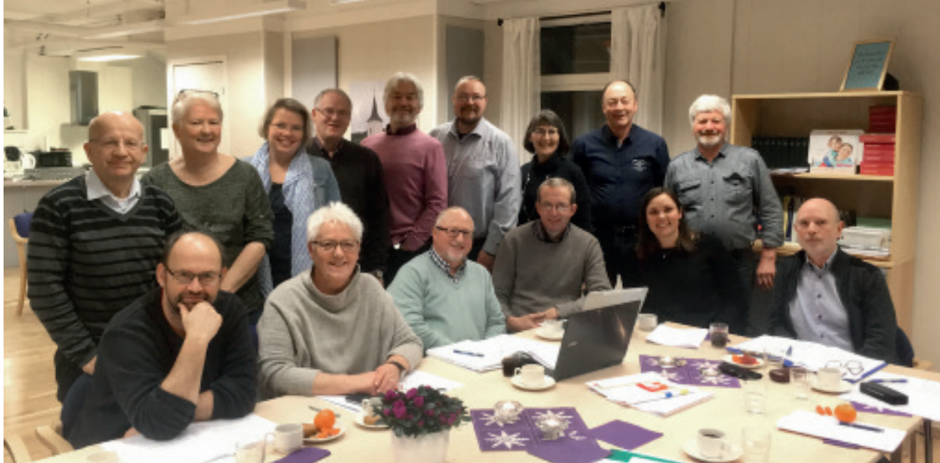
Kyrkjeleg fellesnemnd med representantar frå Meland, Radøy og Lindås