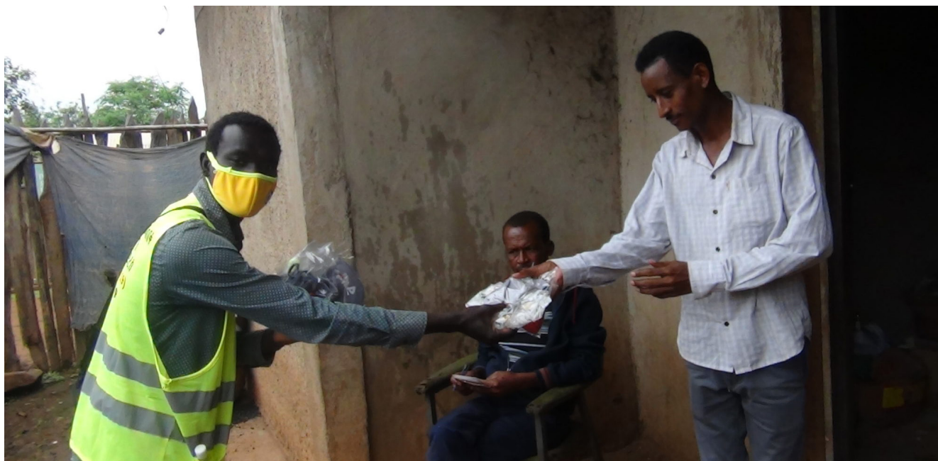
NMS bidreg i kampen mot pandemien, her frå Kamashi i Etiopia.