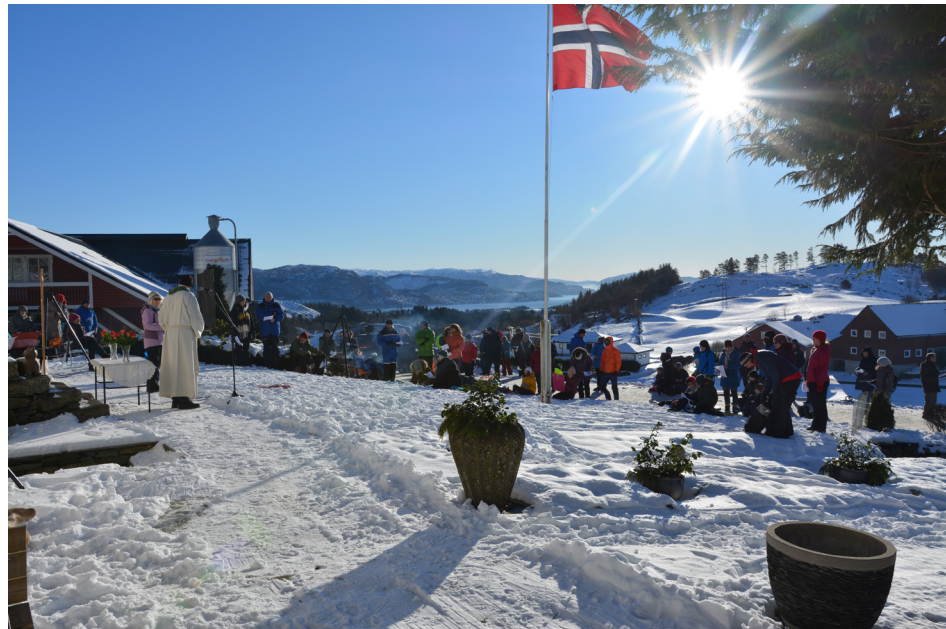
Vakker ramme på Øvre Sagstad for ei friluftsgudsteneste.