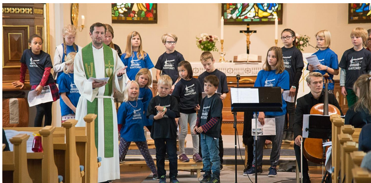
«En borg av håp» - gudstjeneste i Ås kirke