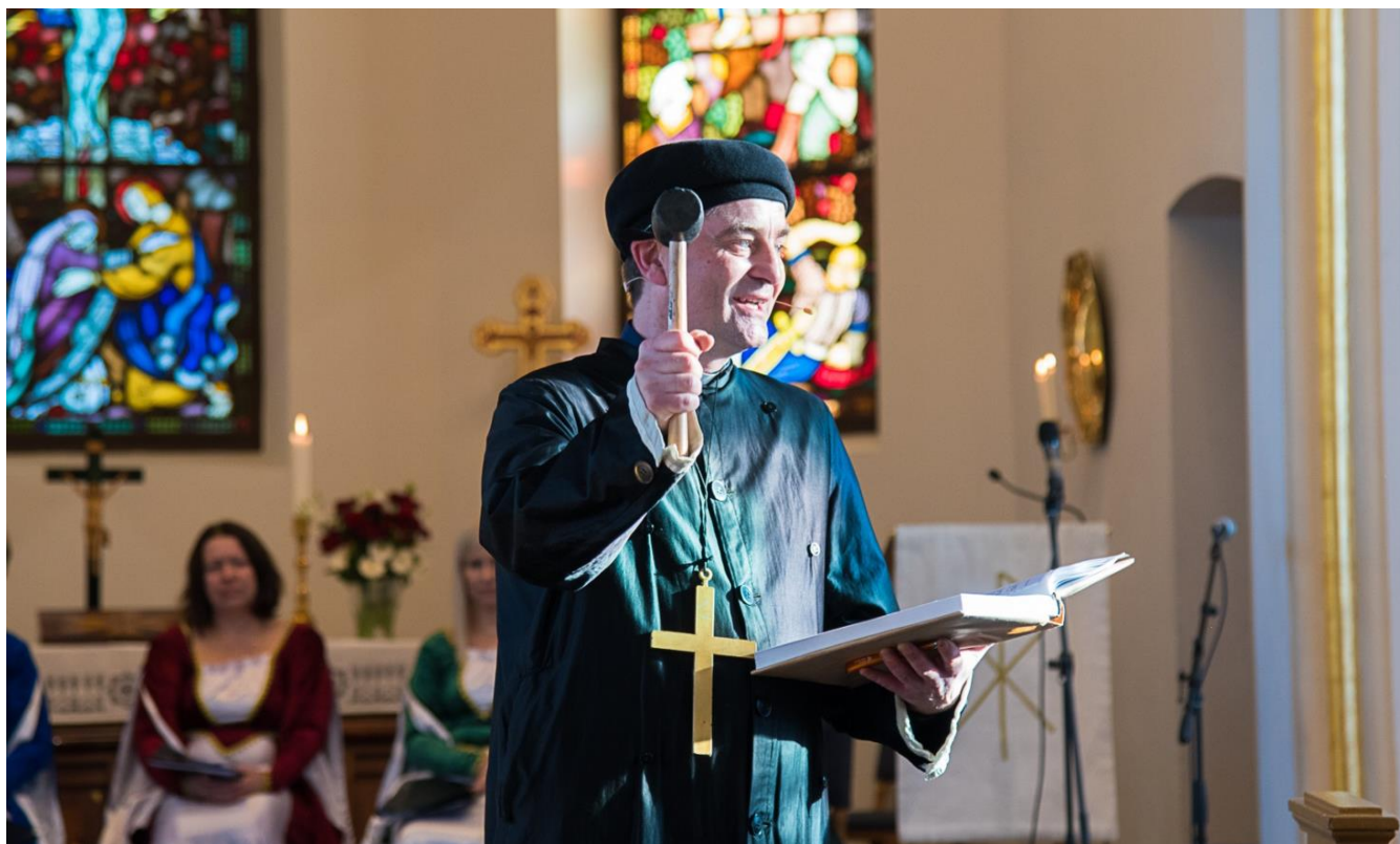
«Det banker» med staben på kirkekontoret.

Vi har et stort ønske om å utvide utvalget med flere medlemmer i 2018. Dersom du kunne tenke deg å gjøre en jobb i utvalget, ta kontakt med soknepresten.