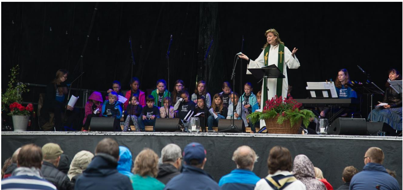
Ås mart'n gudstjeneste