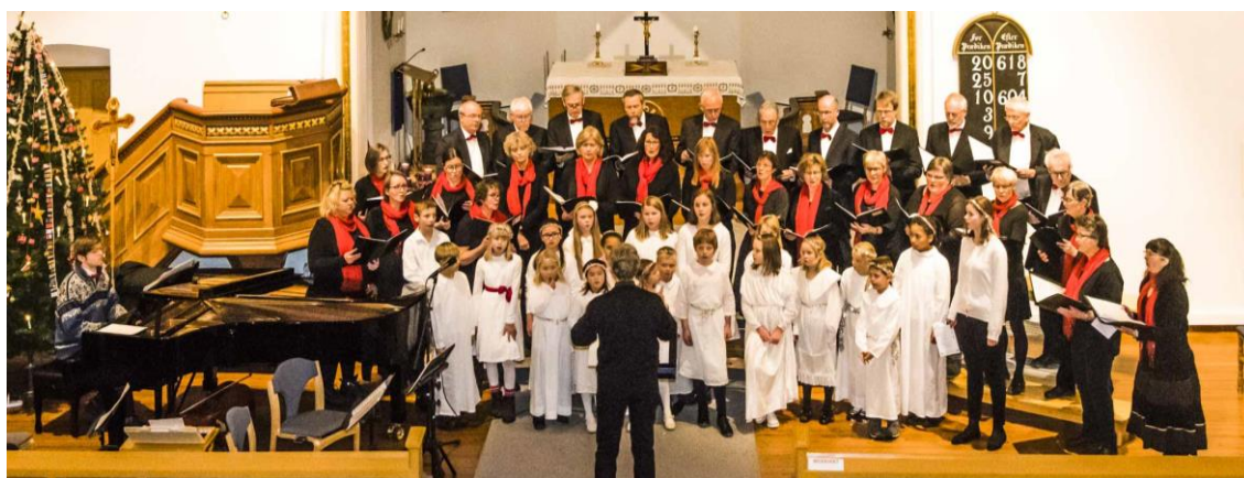
Ås kirkekor og Ås Barne- og ungdomskantori