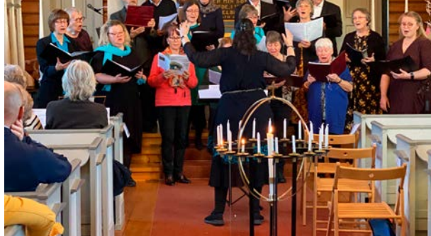
Kroer AdHoc.