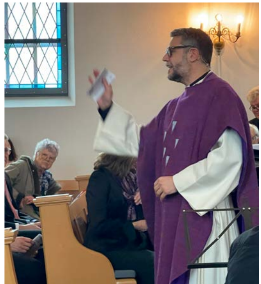
Det er lett å bli engasjert sokneprest i en fullsatt Ås kirke på en helt ordinær, og samtidig ekstraordinær søndag.