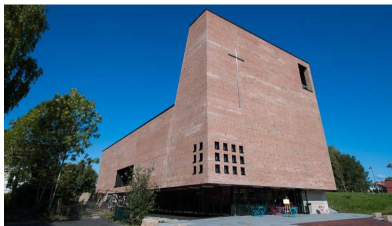
Teglen, Spikkestad kirke- og kultursenter - fra 2018.