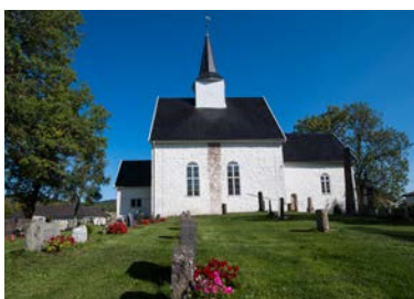
Røyken kirke - fra 1229.