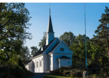
Kongsdelene kirke - fra 1905.