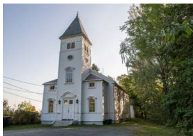
Nærnes kirke - fra 1893.