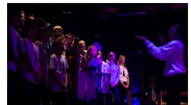
I Østenstad Ten Sing opplever 100 konfirmanter musikkglede og fellesskap.