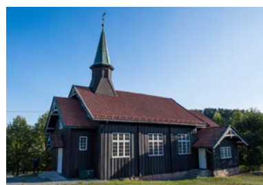
Åros kirke - fra 1903.