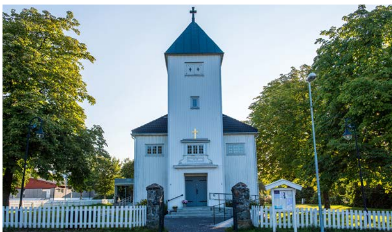
Slemmestad kirke - fra 1935.