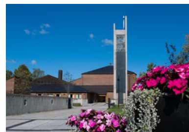
Østenstad kirke - fra 1980.