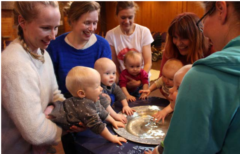
Babysang i Østenstad kirke er populært. Her får de minste se, synge, kjenne og oppleve å være sammen i et hellig rom.

Ønsker du å vite mer om disse aktivitetene? Sjekk kirken.no/ostenstad Ring 66 79 99 60 eller send en epost: ostenstad.menighet. asker@kirken.no