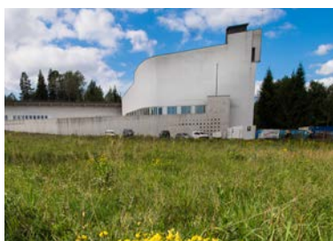
Vardåsen kirke - fra 2004.