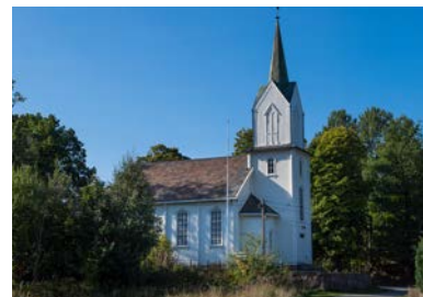
Holmsbu kirke - fra 1886.