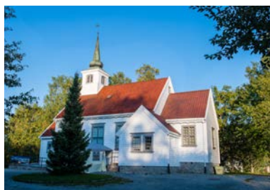
Heggedal kirke - fra 1931.