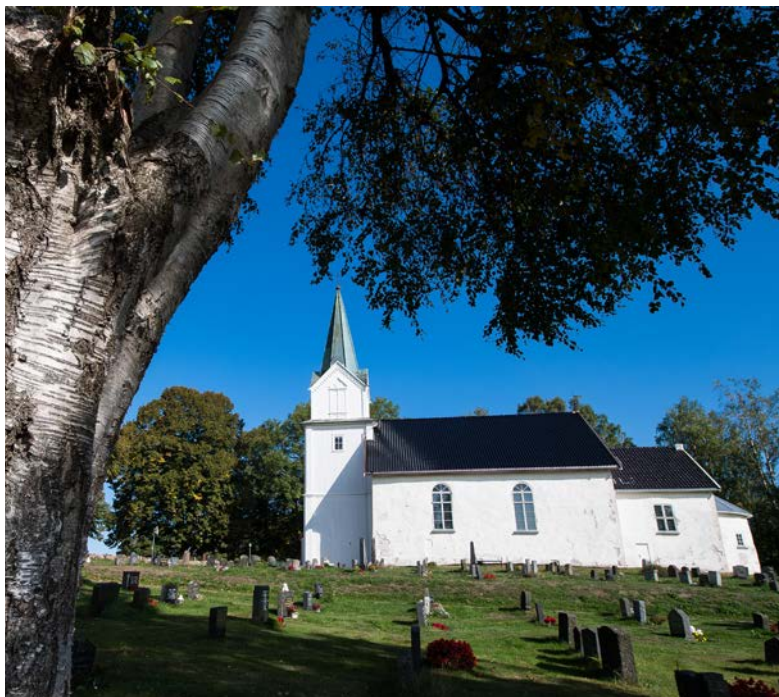
Hurum kirke - vår eldste kirke - fra 1150.

Kirken er i betydelig grad drevet av frivillige, og aktiverer frivillige for engasjement for menighet, nærmiljø og samfunnsansvar. Mange av kirkene framstår som ekstra frivilligsentraler. Vi samarbeider bredt i nærmiljø og kulturliv.