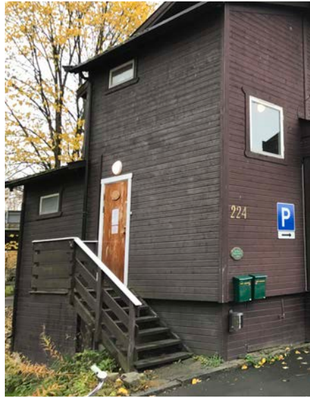
Varmestua i Asker