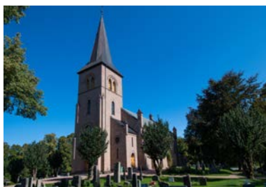
Asker kirke - fra 1879.