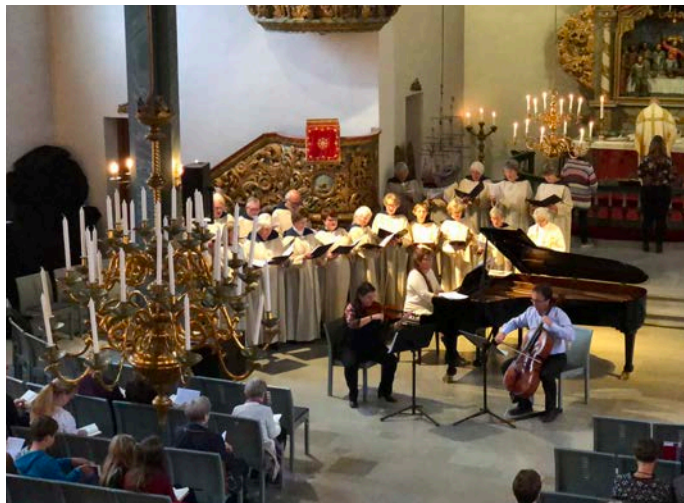
Innvielse av nytt flygel i Asker kirke 14. oktober 2018.

● Kirken malt utvendig (2018) ● Ny atkomstrampe etablert (2018)