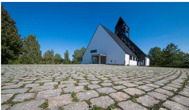
Holmen kirke - fra 1965.