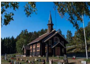
Filtvet kirke - fra 1894.