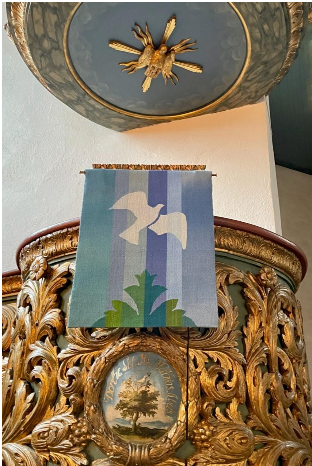
Nytt prekestolklede i Asker kirke