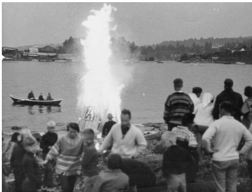
Blakstadbukta og Børsholmen St Hans 1965.

I følge Lukasevangeliet (Luk 1, 26-37) ble Johannes angivelig født omkring seks måneder før Jesus, og derfor er festdagen fastlagt til 24. juni. Denne feiringen er en av ganske få som finner sted på en helgens fødselsdag, ellers er det dødsdagen som feires. At det er kvelden før som feires, kan vi sammenligne med for eksempel jul-, påske- og pinseaften.