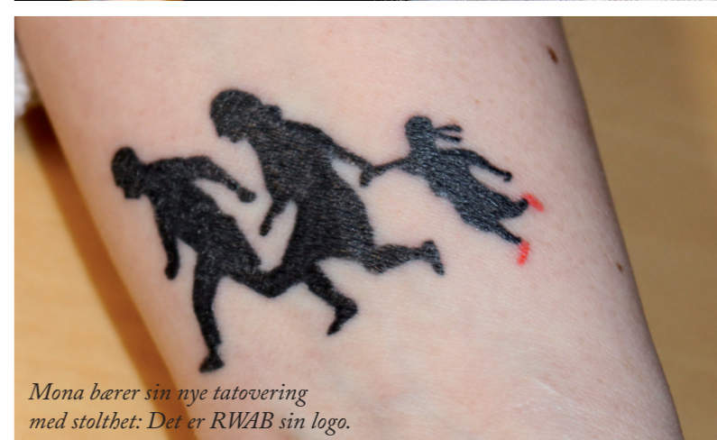
Mona bærer sin nye tatovering med stolthet: Det er RWAB sin logo.