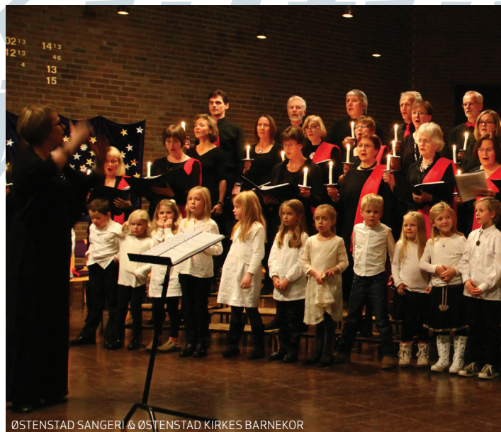
ØSTENSTAD SANGERI & ØSTENSTAD KIRKES BARNEKOR