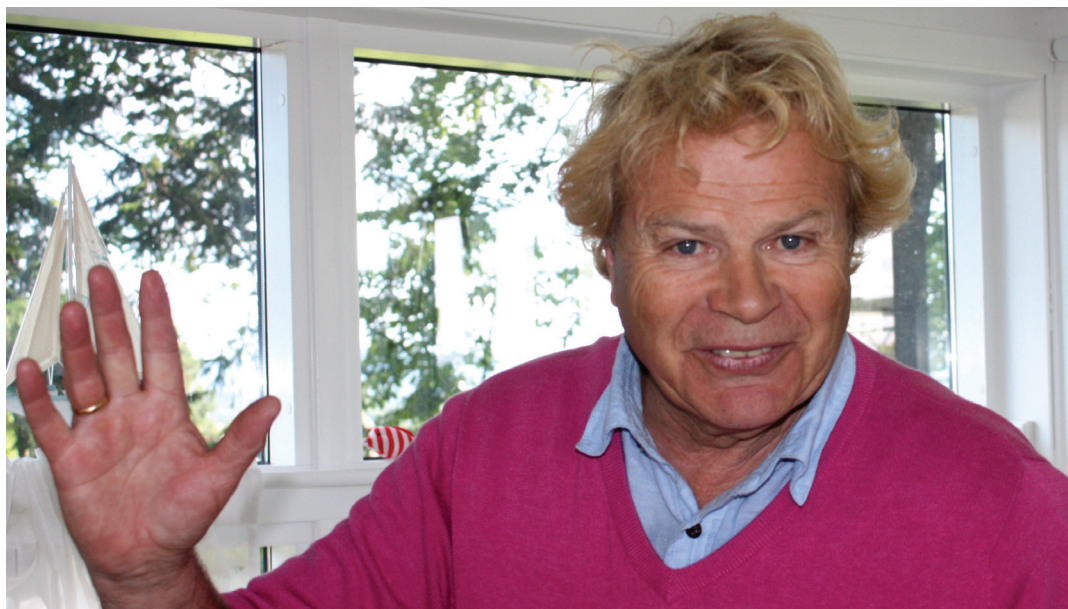
Tekst og foto: Astrid Sætrang Morvik