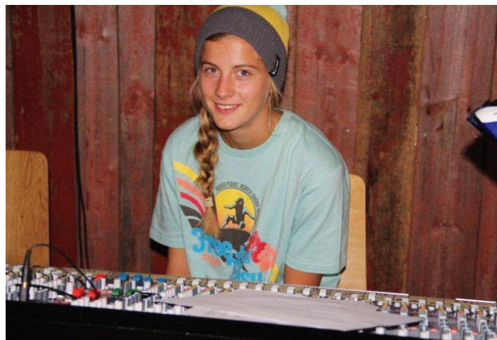
Hanna lærer å mikse lyd