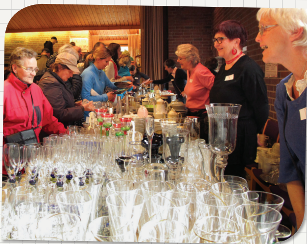
Ved glassdisken.

Salget innbragte over 122.000 kroner og er det nest beste resultatet for Y's Mens loppemarked gjennom 34 sesonger.