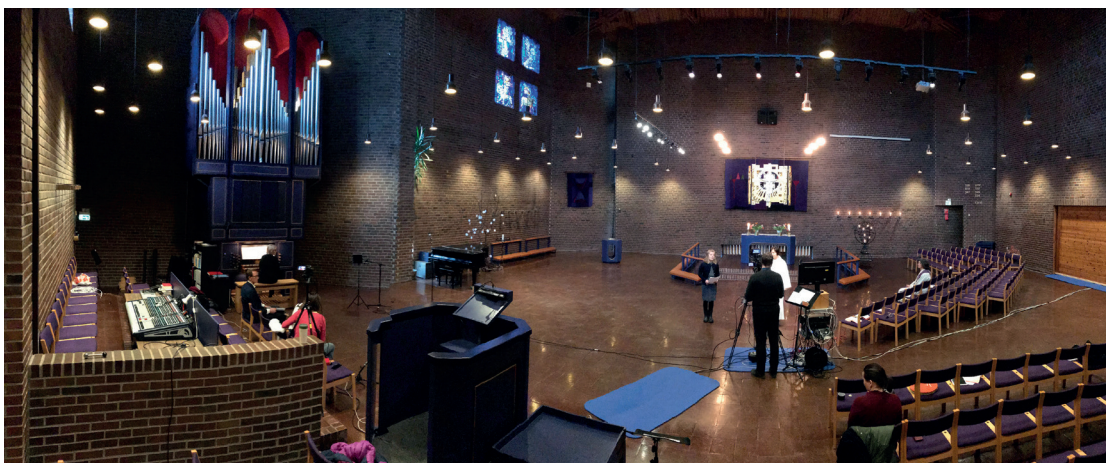
Kirkebenkene var tomme, men gudstjenesten ble tatt godt imot hjemme hos menigheten.

Også Facebook-gudstjenesten gikk fint. Og ettersom det ikke var noen som kunne gå rundt for å ta opp kollekt, ble det gitt beskjed om at offergavene denne gang kunne betales med VIPPS.