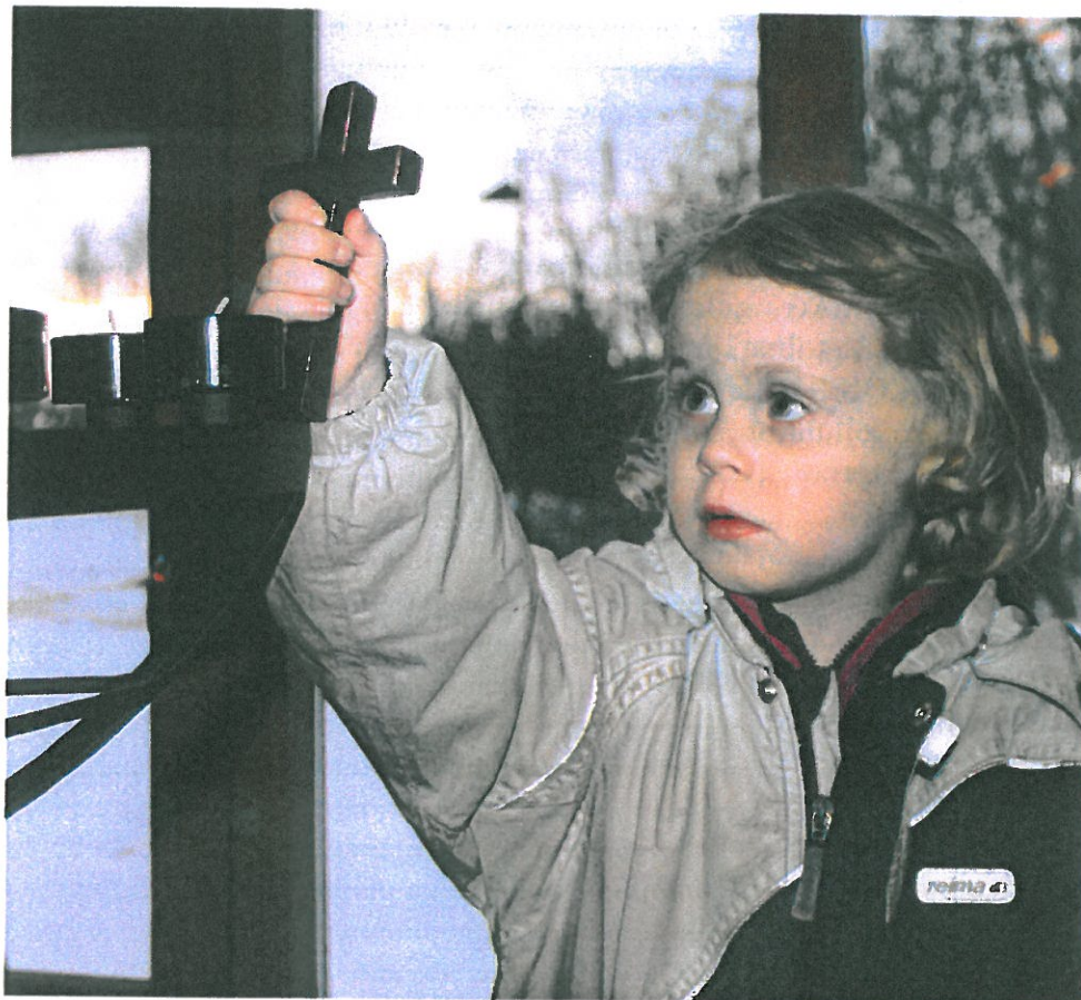
Thea tar grep om korset på søndagsskolens lysbåt!