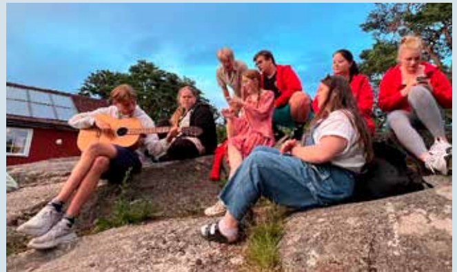
God jamstemning på kvelden!

fra Røyken og Åros har vært på leir på Knattholmen leirsted og hatt det strålende i fint vær og mange gode aktiviteter som sport, båtliv, revy, dans, kjempehuske og flotte bademuligheter! Vi hadde også med ungdomsledere som har gått «Ung leder»-kurs som fjorårskonfirmanter, samt andre ungdomsledere fra menigheten som gjorde en flott innsats. Vi har allerede fått flere konfirmanter som har meldt seg til neste års ledertreningskurs, og vi gleder oss til å følge dem videre til høsten også etter konfirmasjoner i september.