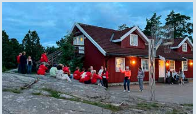
Eventyrtunet på Knattholmen leirsted