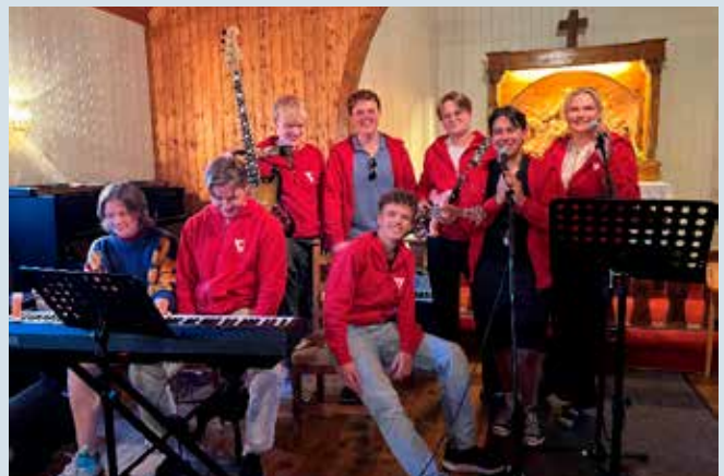
Bandet på leir