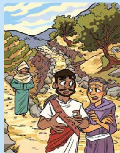
Tegning: Faye Simms

Bruk Det nye testamentet i Bibelen for å komme frem til løsningsordet.