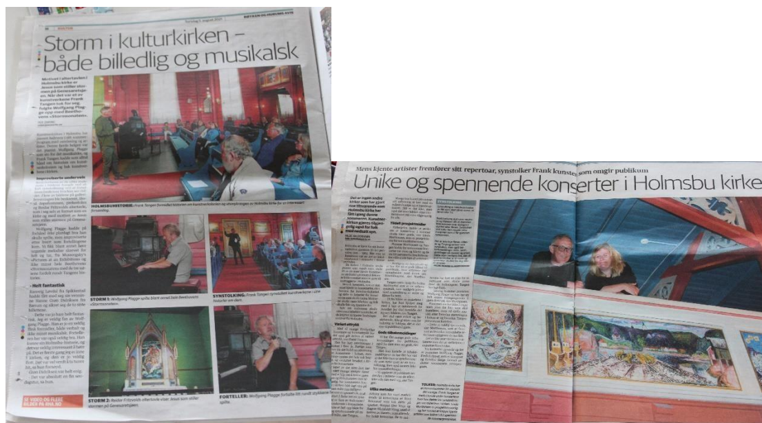
Utklipp fra Røyken og Hurums Avis

Vi har vist frem Kunstnerkirken fra sin beste side og i de fineste rammene. Historien bak kunsten har forbausset og engasjert i tillegg til at den har vist mangfoldet av kunstnere som kan dekorere en kirke. Det vi har prøvd å formidle er forhåpentligvis at kirken er åpen for alle, og kan brukes av alle.