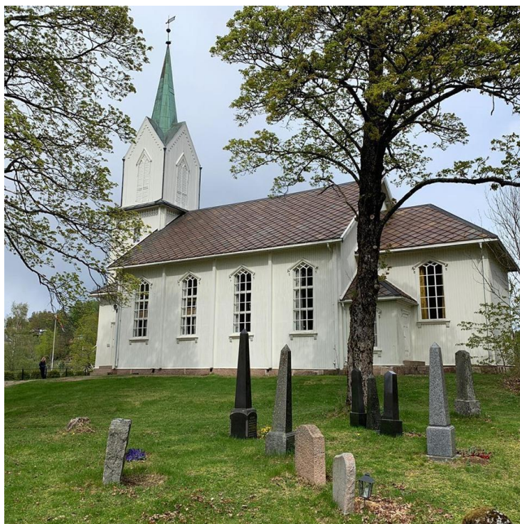
Holmsbu kirke