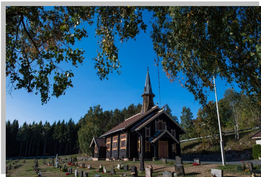
Filtvet kirke