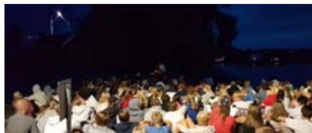
Sang og bålkos på kvelden