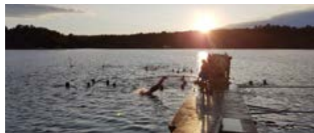
Bading hører med på konfirmantleiren