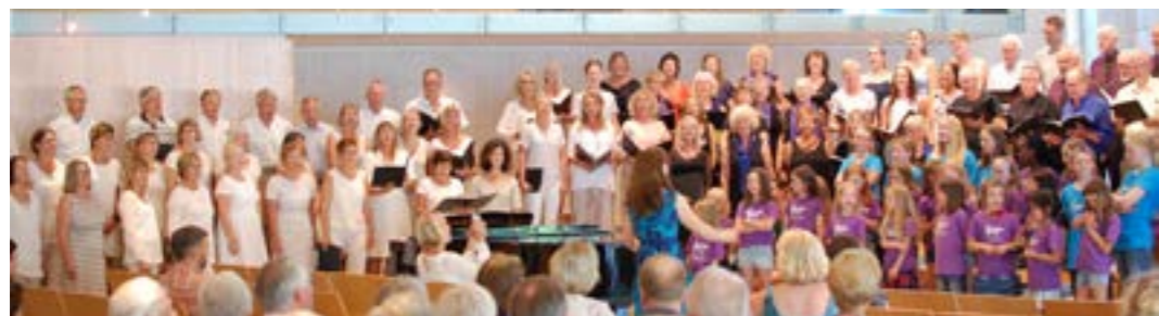
12 kor deltok på Kormaraton i Vardåsen kirke 27. mai