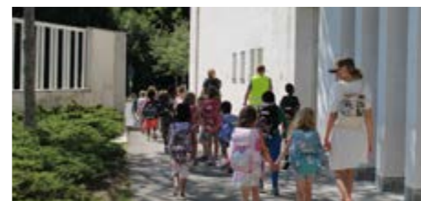
Elever fra Vardåsen skole på vei hjem etter temadag i kirken om Frans av Assisi