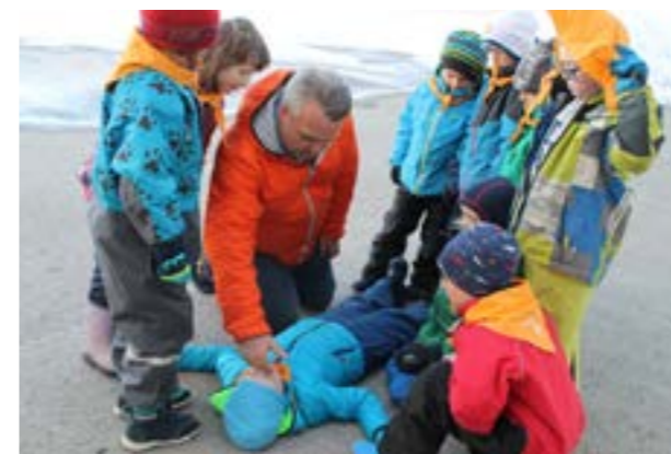
Familiespeiderne lærer førstehjelp