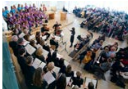
En fullsatt kirke på orgelinnvielsen 18. mars