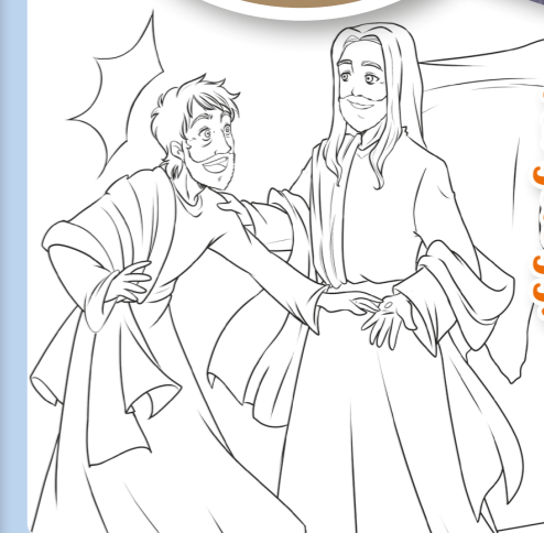
Tegning: Chiara Bertelli

Bestill abonnement på sondagsskolen.no eller 22 08 71 00