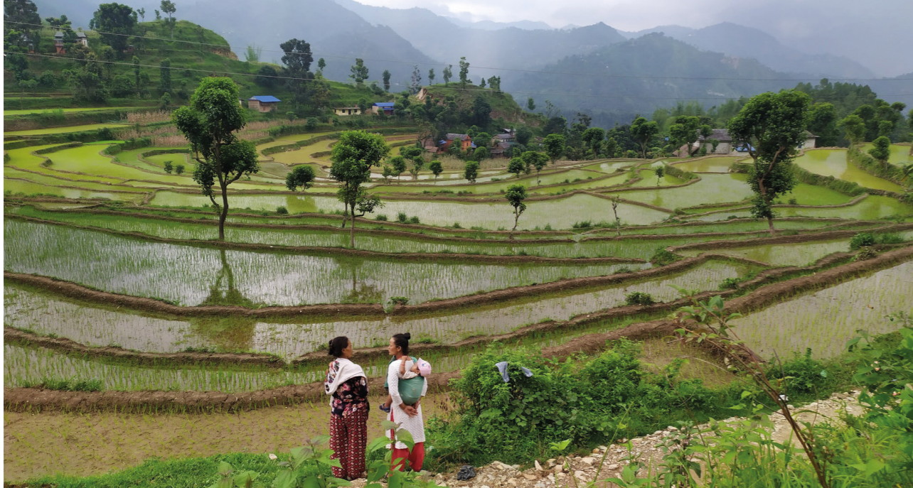
OKHALDHUNGA SYKEHUS I NEPAL