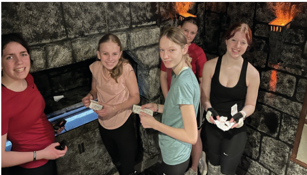
Ei fornøyd gruppe som har kommet seg gjennom Maya-riket-banen og har stemplet deltakerkortene sine. Hvem kom seg gjennom flest baner, tro?