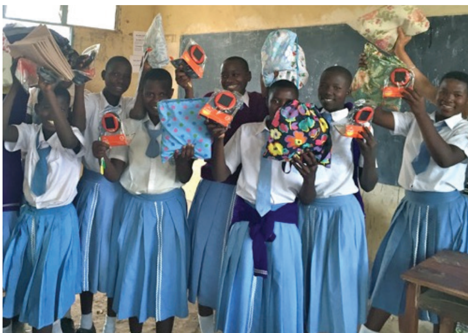
TUMAINI gir posene til jenter i Tanzania

Dessuten må alt lages på eksakte mål, og være av en slik utforming at de kan henges ut til tørk uten at forbigående ser at det er bind eller bindholdere som henger på snoren.