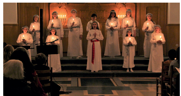
Lucia 2017.

TORS DAG 13. DESEMBER KL 19.00 I KAPELLET