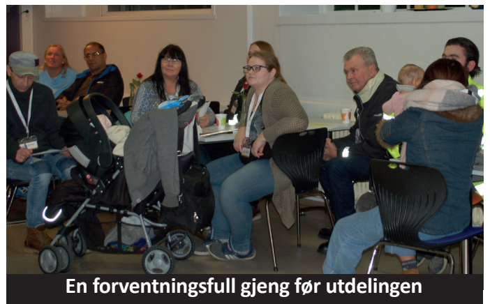
En forventningsfull gjeng før utdelingen