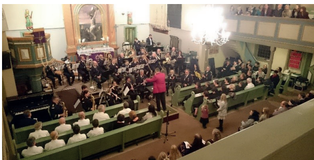
Askim janitsjar spiller(2017).

Askims lokale krefter bidrar til den tradisjonelle konserten i kirken før jul og fyller kirken vår med julesang og julemusikk. Andakt, allsang og kollekt ved utgangen.