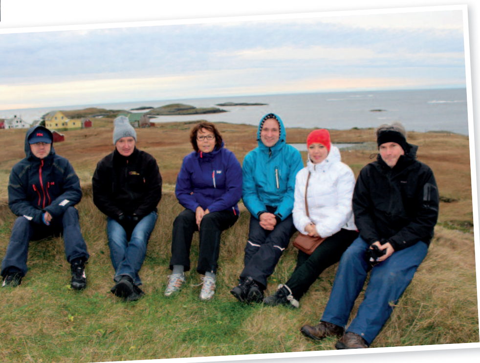
Ved fyret på Sandøy

For fjerde år på rad var soknerådet i Askvoll og dei kyrkjeleg tilsette samla ein haustweekend i november. Tidlegare år har desse samlingane vore lagt til Bergen, men i år satsa ein på ein lokal destinasjon, nærare bestemt Floren i Bulandet. Utanom god mat, underhaldning og mykje sosialt samvær vart det rom for både båttur og seminar med fokus på strategiarbeid for soknet. Ein skipa til «Visjonær verkstad» mellom anna med gruppearbeid, der ein skulle peike ut ulike satsingsområde og strategiar soknet bør ha i arbeidet i tida framover.