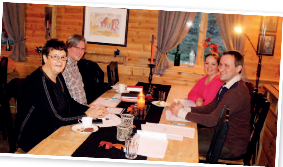
Frå ei av gruppene på strategiseminar

For fjerde år på rad var soknerådet i Askvoll og dei kyrkjeleg tilsette samla ein haustweekend i november. Tidlegare år har desse samlingane vore lagt til Bergen, men i år satsa ein på ein lokal destinasjon, nærare bestemt Floren i Bulandet. Utanom god mat, underhaldning og mykje sosialt samvær vart det rom for både båttur og seminar med fokus på strategiarbeid for soknet. Ein skipa til «Visjonær verkstad» mellom anna med gruppearbeid, der ein skulle peike ut ulike satsingsområde og strategiar soknet bør ha i arbeidet i tida framover.