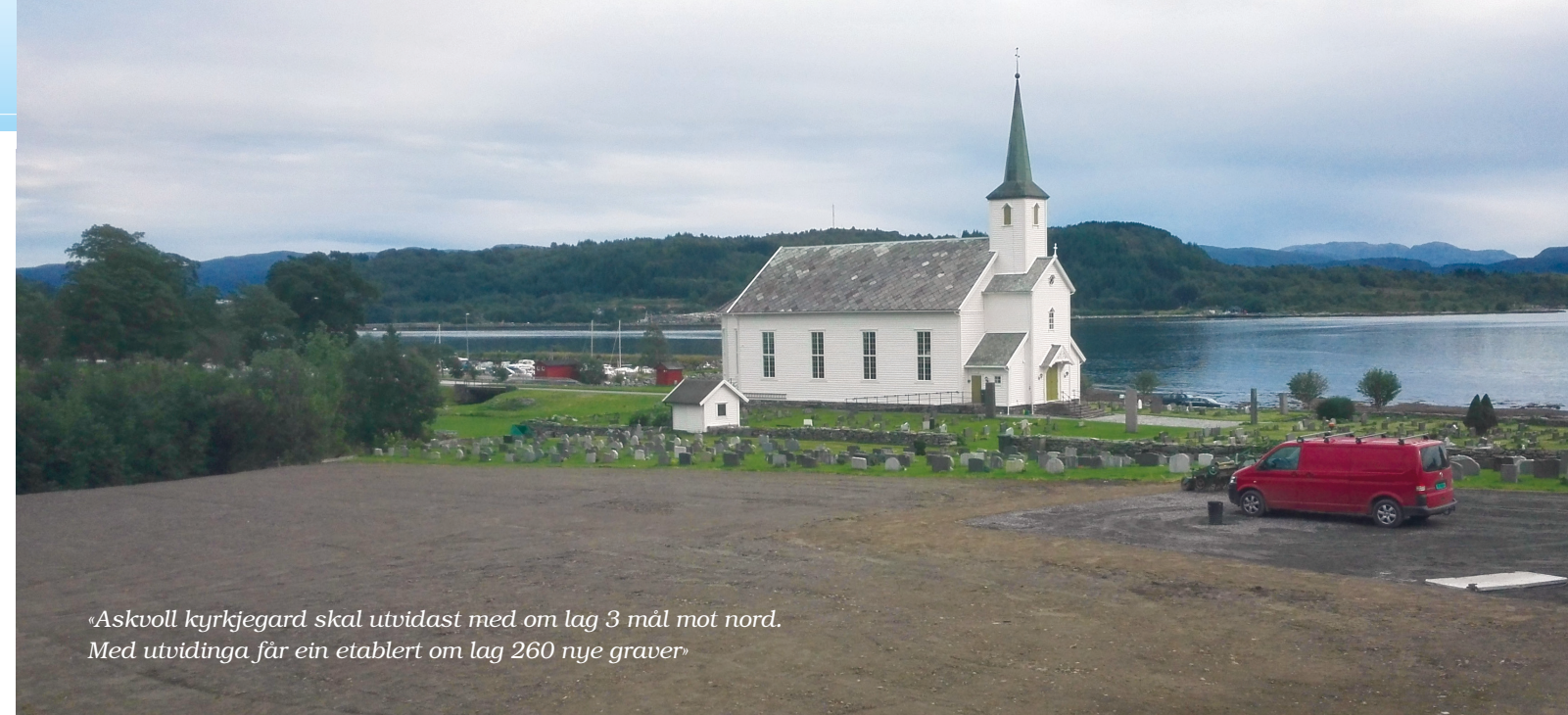
«Askvoll kyrkjegard skal utvidast med om lag 3 mål mot nord. Med utvidinga får ein etablert om lag 260 nye graver»