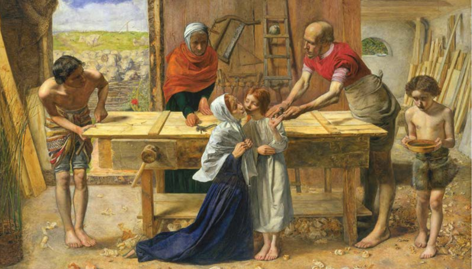
Christ in the House of His Parents ('The Carpenter's Shop') 1849-50; Sir John Everett Millais, Bt 1829-1896; Tate, Purchased with assistance from the Art Fund and various subscribers 1921