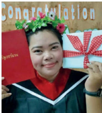
I juni 2018 var det utdeling av vitnemål for de som avsluttet studiene ved det lutherske seminaret i 2017.