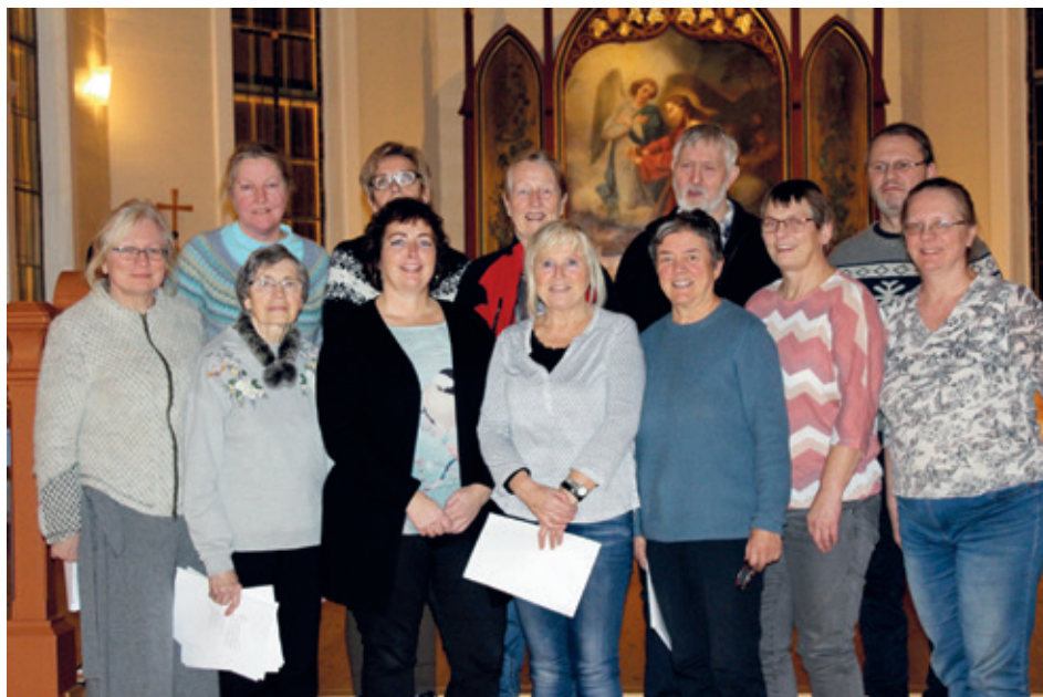
På øving i kyrkja.