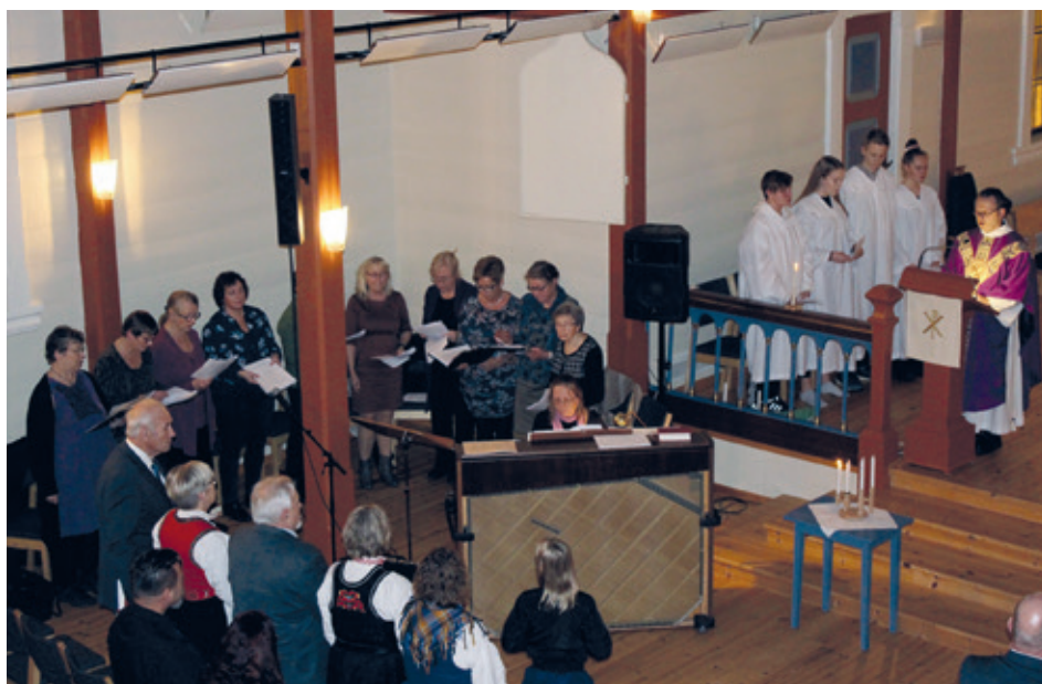
Kyrkjekoret deltok på lysmessa i Askvoll kyrkje første søndag i advent.

Kyrkjekoret vart oppretta i januar 2018. I starten var vi åtte koristar. I dag er vi oppe i 13 medlemmer og vi håpar på at vi blir fleire etter kvart. I repertualet har vi først og fremst kjente norske salmar og songar. I år 2018 deltok koret i to gudstenester og på to konsertar. Vi øver kvar torsdag i Askvoll kyrkje frå kl. 18 til kl. 20. Etter nyttår startar vi øvingane 10. januar.