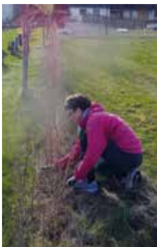
Aud fjernar råtegras i heggen på den nye kyrkjegarden.