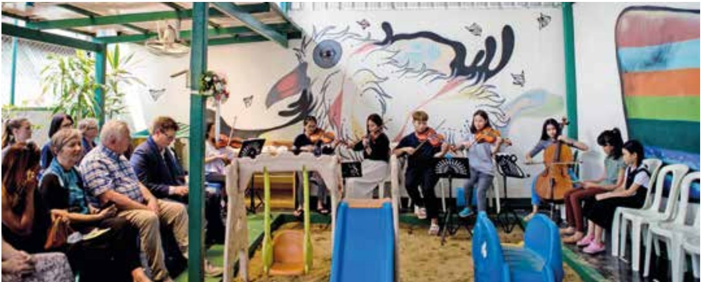
En gruppe fra Immanuel musikk-skole spiller før den offisielle åpningen.