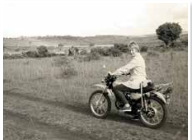
Liv på motorsykkeltur i 1976.

I mars i år fikk jeg som pensjonist og syttiåring dra tilbake som volontør/vikarlærer på den desentraliserte norske skolen i Hawassa, administrasjonsbyen for regionen i sør. Det ble to og en halv måneds undervisning for tre norske barn fra to familier som