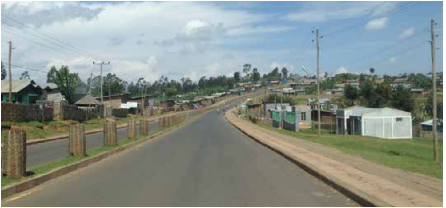
Nye veier i Hagere Mariam.

Før tok det lang tid å forflytte seg rundt på feltet vårt, på til dels dårlige veier. I dag satser Etiopia på veibygging og det er helt utrolig å suse av gårde på flotte, breie asfaltveier med krabbefelt etc. Inn til alle byer og inne i byene er det midtrabatter med vakker beplantning og to felt i hver kjøreretning. Det var nesten stusslig å komme hjem til gamlelandet og se at Olsetveien enda ikke hadde fått ny asfalt engang.