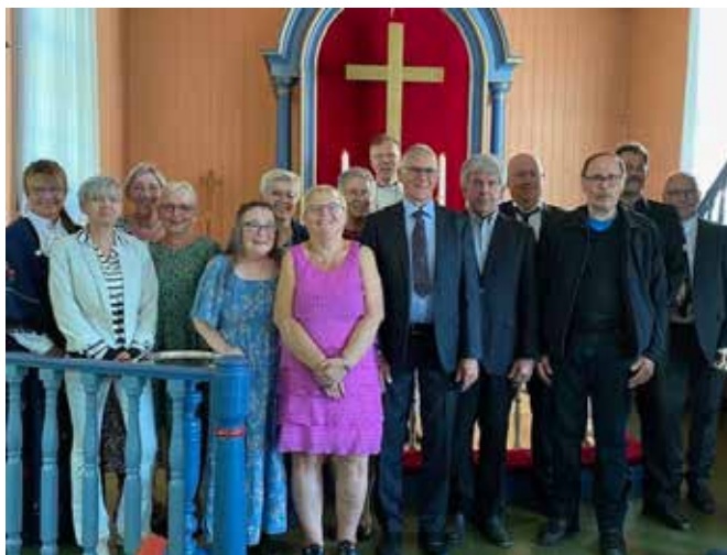
Gullkonfirmanter og prest i Malangen kirke 16.6.2024

Det hadde gått veldig fint, så konfirmanter kunne senke skuldrene og ta inn over seg høytideligheten når 24 ungdommer med hvite kapper gikk i prosesjon til alles oppmerksomhet. En fotograf tok bilder av konfirmanter og presten på kirketrappa når gudstjenesten var over. Etterpå tok vi private bilder i lag med de vi ville, ute på kirkebakken. Det var rikelig med tid og ikke noe stress. Og bildene fikk vi først se