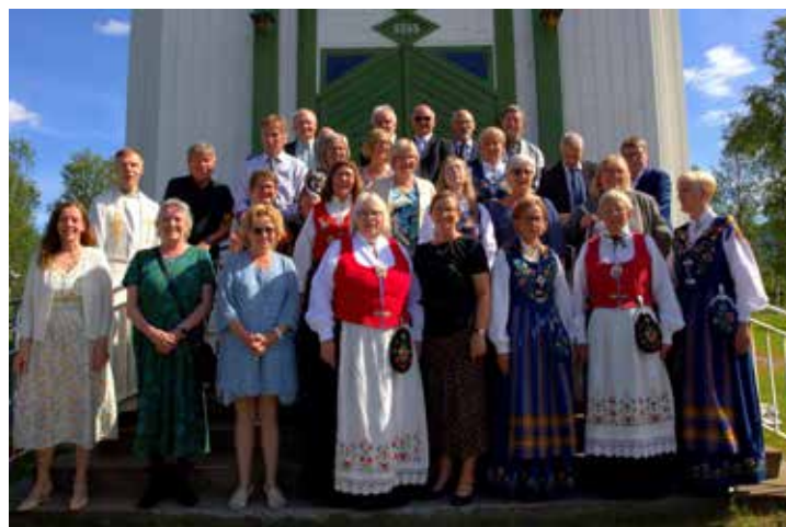
Gullkonfirmanter og prest ved Balsfjord kirke 23. juni 2024

En gang var en gruppe med ungdommer fra Nordkjosbotn blitt akterutseilt etter en lørdagsfest på Storsteinnes. Dette var lenge før mobiltelefonens tid, å bestille seg drosje var heller ikke aktuelt. Langt ut i de små timer bega de seg på hjemvei, til fots – en tur som sikkert ville tatt minst tre timer før de ville vært hjemme. Omtrent på Markenæs møtte de imidlertid Børre Knudsen, på vei i motsatt retning, mot Storsteinnes. Han stoppet og spurte hvor de var på vei, og fikk den saklige forklaringen. Uten å nøle mer tilbød han seg å kjøre dem hjem, og berget dem unna en lang nattlig