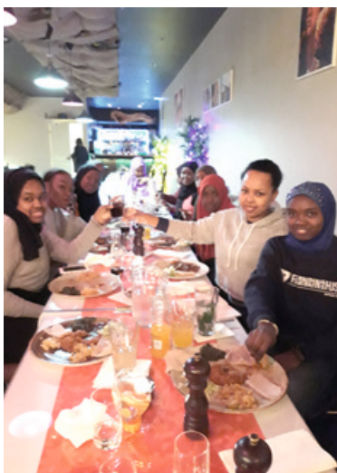
Etter gjennomført svømmekurs feiret jentene med festmiddag.