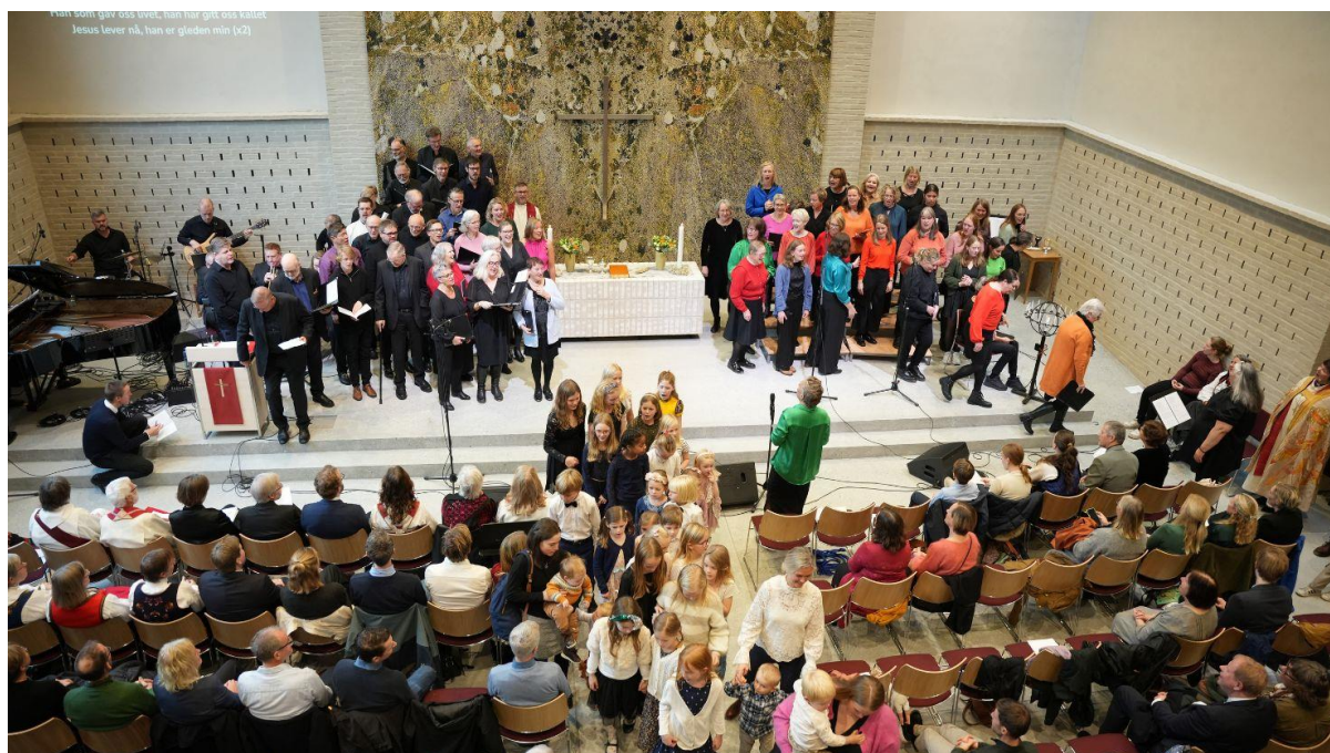
Vigslingsgudstjeneste i Sædalen kirke 3. november 2024